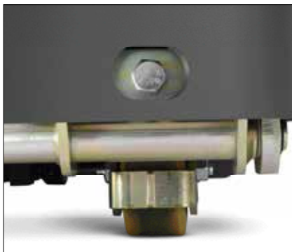
Rueda pequeña ProTracLink opcional

Las ruedas pequeñas son una de las partes que reciben servicio con más frecuencia en todo montacargas de viajero de extremo. Pero, el ECR permite el ajuste automático de las ruedas pequeñas, sin tener que levantar el montacargas, ahorrando tiempo y dinero.