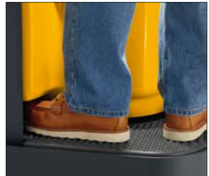
Plataforma del operador

La plataforma del operador cuenta con una área de superficie espaciosa, que proporciona a sus operadores la capacidad de ajustar confortablemente sus posiciones a lo largo del día. Además, el "espacio para los pies" permite una postura más amplia y ayuda a asegurar que los pies de sus